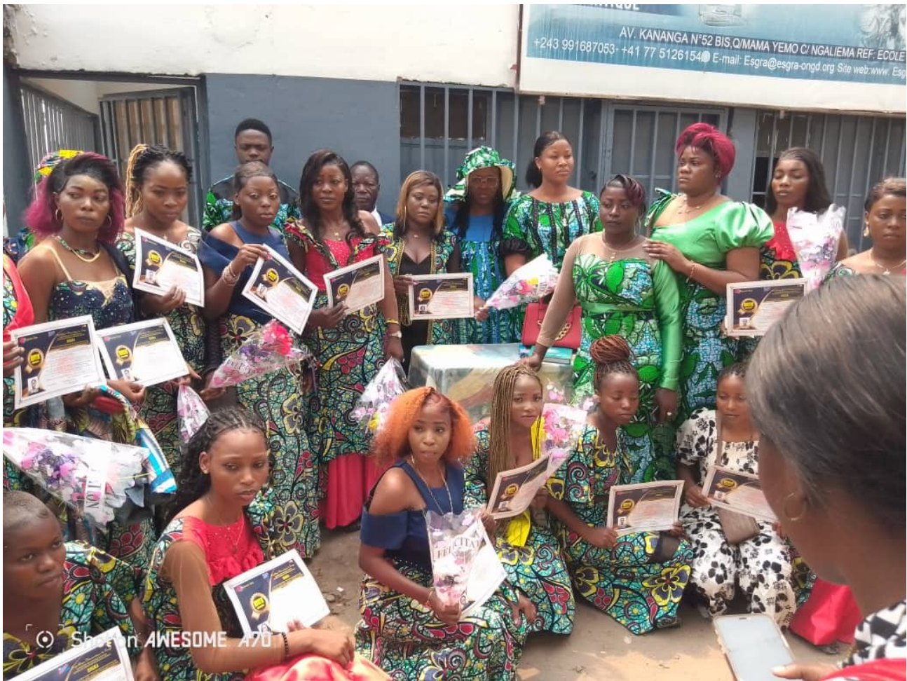
Nouvelles diplômées avec brevet, Centre de formation Kinshasa, 2024