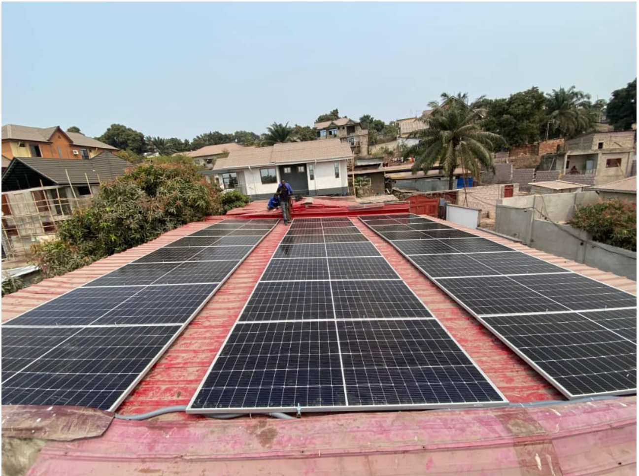
Panneaux photovoltaïques sur le toit du Centre de formation à Kinshasa, 2024

Des travaux plus importants que prévu ont été réalisés, indispensables pour la sécurité des lieux, surtout avec une installation électrique de grande envergure. Un local pour les batteries des panneaux solaires a dû être construit pour protéger contre le vol et l'incendie.